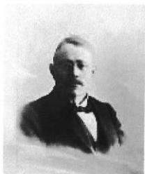
Fig. 3 Othar Lützhøft Roskilde Lokalhistroiske Arkiv

franskmændenes bombardement af Casablanca samme år, en forestilling, som fik mange anmelderroser for sine gode, stabile og lysstærke billeder. 68