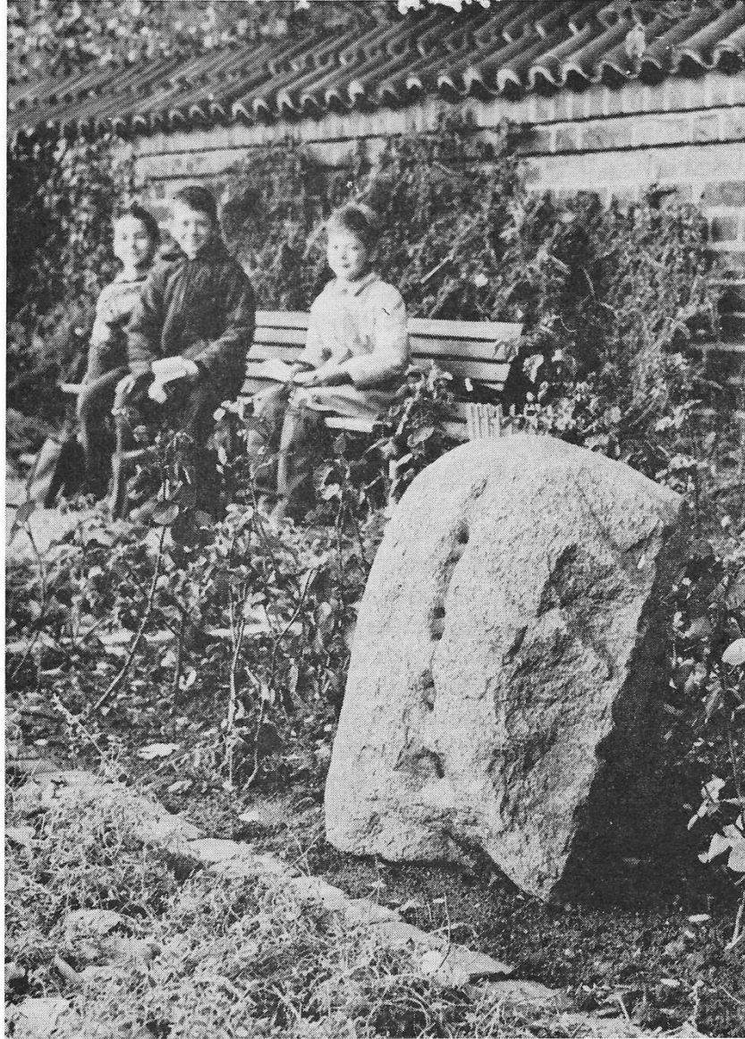
Karl Gustavs sten på torvet i Roskilde.