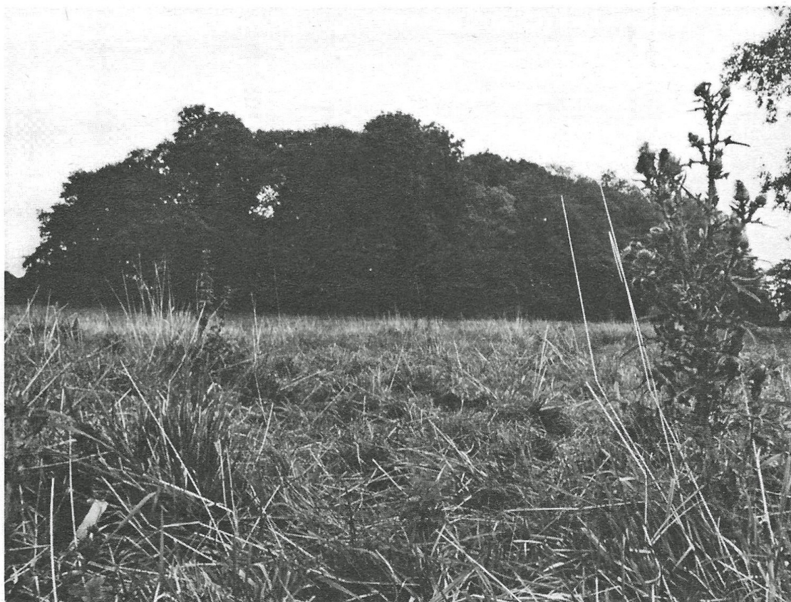
Tjørnehøj ved Sortesti

Lidt udenfor Roskilde ved Sortesti mod Boserup ligger en høj kaldet Tjørnehøj. I 1800-tallet fortalte man det i virkeligheden var Vifils ø, der nu som en høj lå i det lave engdrag, hvor der før havde været et sund.