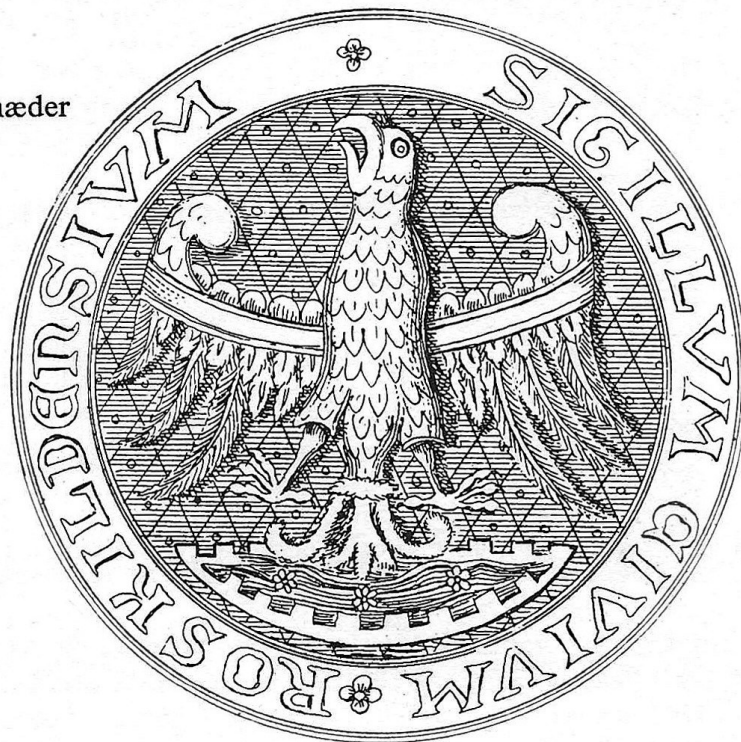
Roskilde Byvåben. Træsnit 1832

Helge: Jeg sejler vore snekker på søens vover; og hævder Danmarks hæder på alle have.