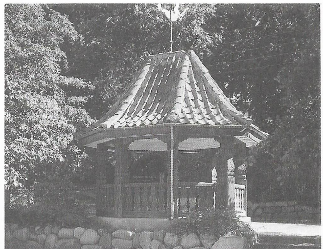
Kildehuset ved Maglekilde med søjomfruen på taget.

gav han alt, hvad han ejede til »Lillehjemmet«, fordi han følte årene dér som nogle af de bedste, han havde kunnet ønske sig. Mange af hans arbejder blev solgt ved auktion, og pengene herfra blev brugt til hjemmets beboere.