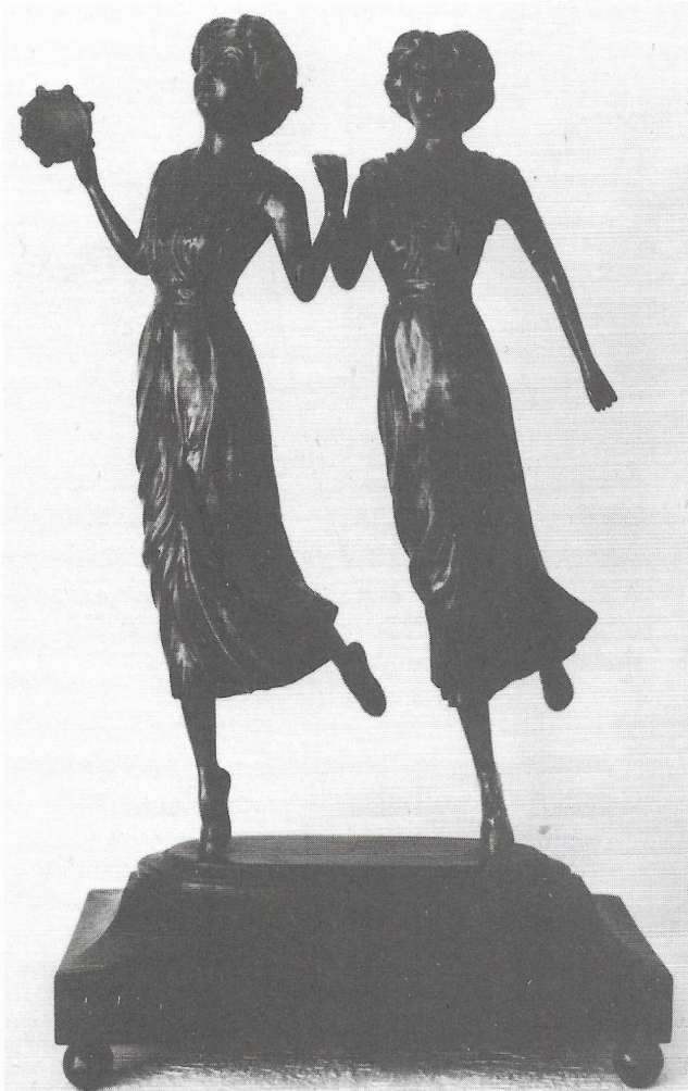
Svend Klamer: »Danserinder med tambourin«.