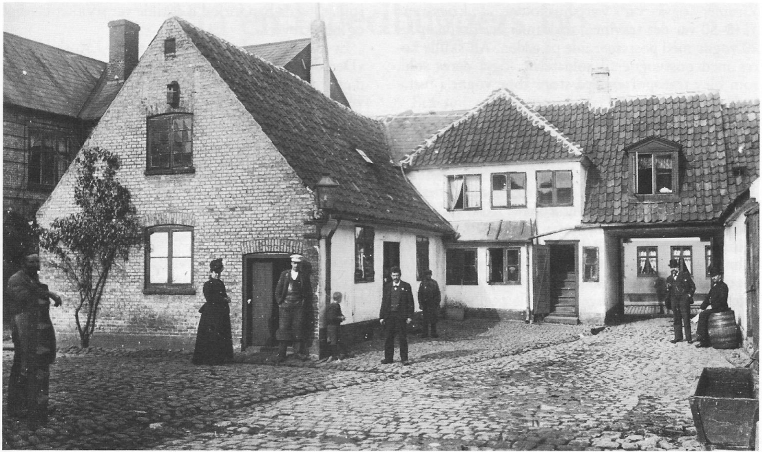
Schrams gård, Skomagergade 27.

helgensstræde berørt af ilden, Lille Allehelgensstræde, som lå mellem Allehelgensgade og Gullandsstræde blev nedlagt. De nye huse skulle også være ensartede. Det blev for det meste til små huse med en stueetage med et eller andet antal vinduer, en dør i midten og eventuel en port og desuden en kvist, hvis størrelse var nøje fastsat i forhold til facaden, men den kunne blive med 3 fag vinduer. Husene blev derefter kalket og husrækkerne må have set nydelige ud med de mange forskelligt farvede huse. Roskilde var rigtigt forarmet: først branden i Algade 1731 og nu branden i Skomagergade. Kæmneren måtte i november meddele, at der kun var kommet 24 rigsdaler ind af de udskrevne skatter, de brandlidte havde ikke kunnet betale.