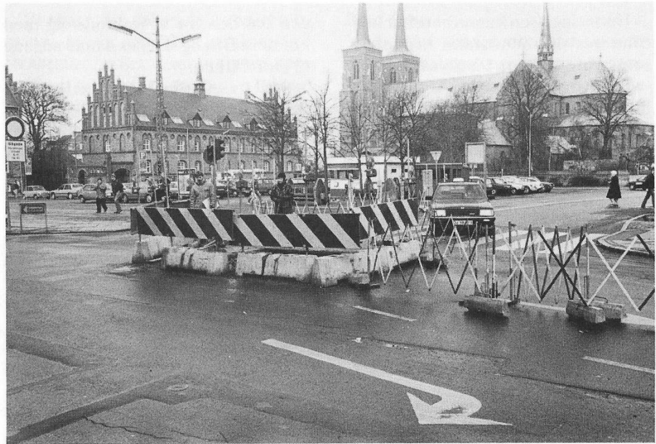
Fig. 3. Stændertorvet set mod nord. Udgravningen skjuler sig bag afspærringen midt i billedet. (Foto forfatteren).

Palæ opført, og samtidig blev en nyanlagt gade ført fra torvet op til porten. Gaden fik navnet Palæstræde (snart efter dog Nygade).