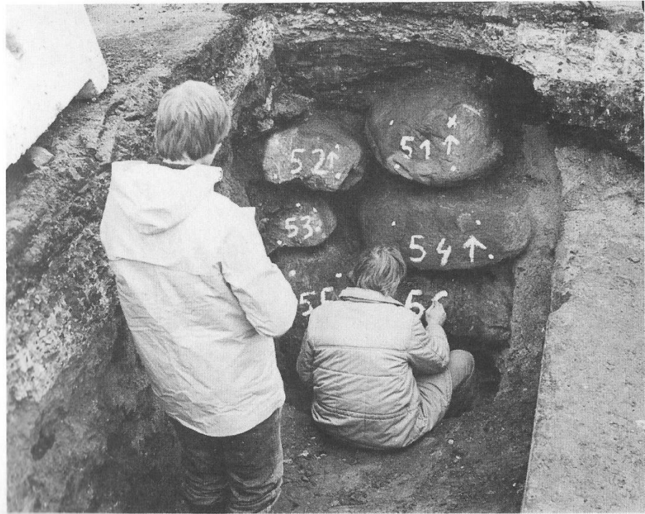
Fig. 4. Brøndens sten markeres med nummer og fire målepunkter af hensyn til den fotogrammetriske opmåling og senere genfremstilling.

Roskilde har således stadig sin »Byens Brynd«. Den ligger der på torvet og kan undersøges nærmere, når lejligheden byder sig. Måske kunne man også en dag tænke sig at se den i funktion igen. Det lader sig let gennemføre, for det eneste, der skal rekonstrueres, er brøndhuset.