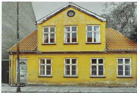
Foto: Herover ses billede af Store Gråbrødrestræde 14, set fra gaden

Da Liszie døde i 2013 købte en familie med rødder i Roskilde huset. Min familie takkede af efter næsten 100 år, hvor 4 ud af 5 generationer havde boet dér.