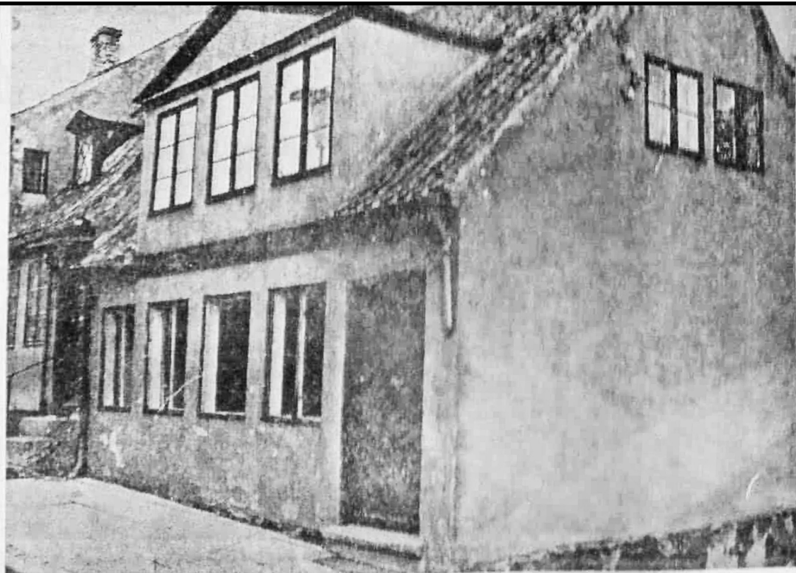
Ejendommen „Wilhelm Topps Minde“, der ejes af Roskilde Domkirke - og som kunne være et ganske pænt lille hus, hvis det blev vedligeholdt. Der er ikke -hvad mange måske tror - opført nogen fredning af den i tingbogen